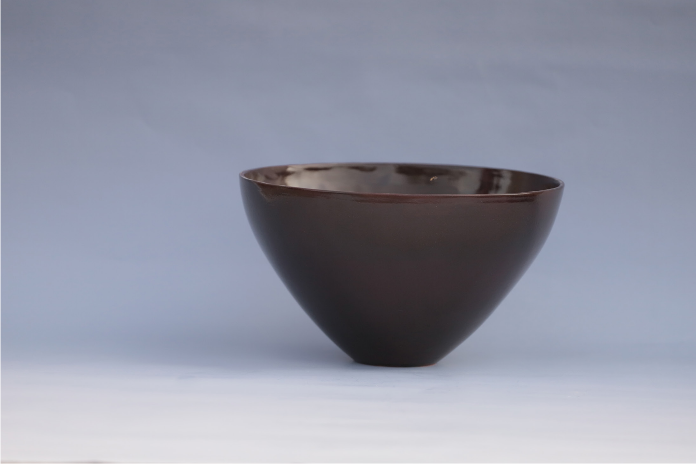
Seramik anak 1160 °C, 7,5 x 30 x 15,5 cm, 2018