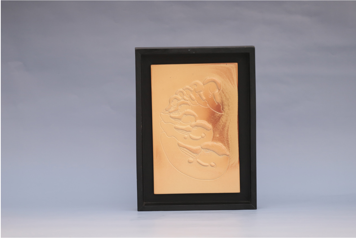
Frig 5, Seramik Pano Rölyef Tekniđi, 1160 °C, 18 x 27 cm, 2019