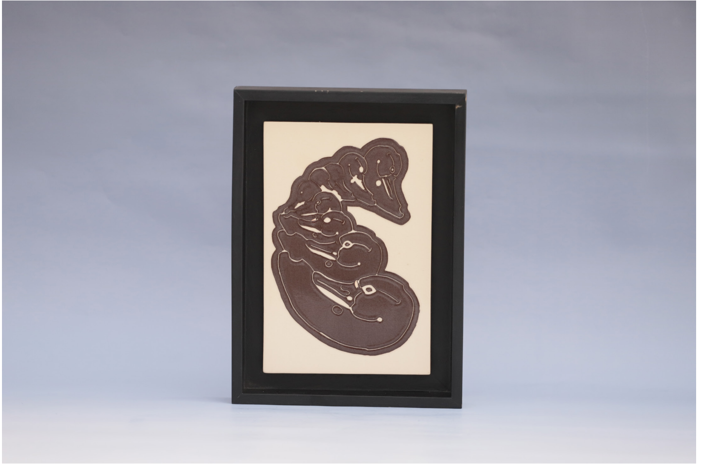
Frig 4, Seramik Pano Sigrafitto Tekniđi, 1160 °C, 18 x 27 cm, 2019