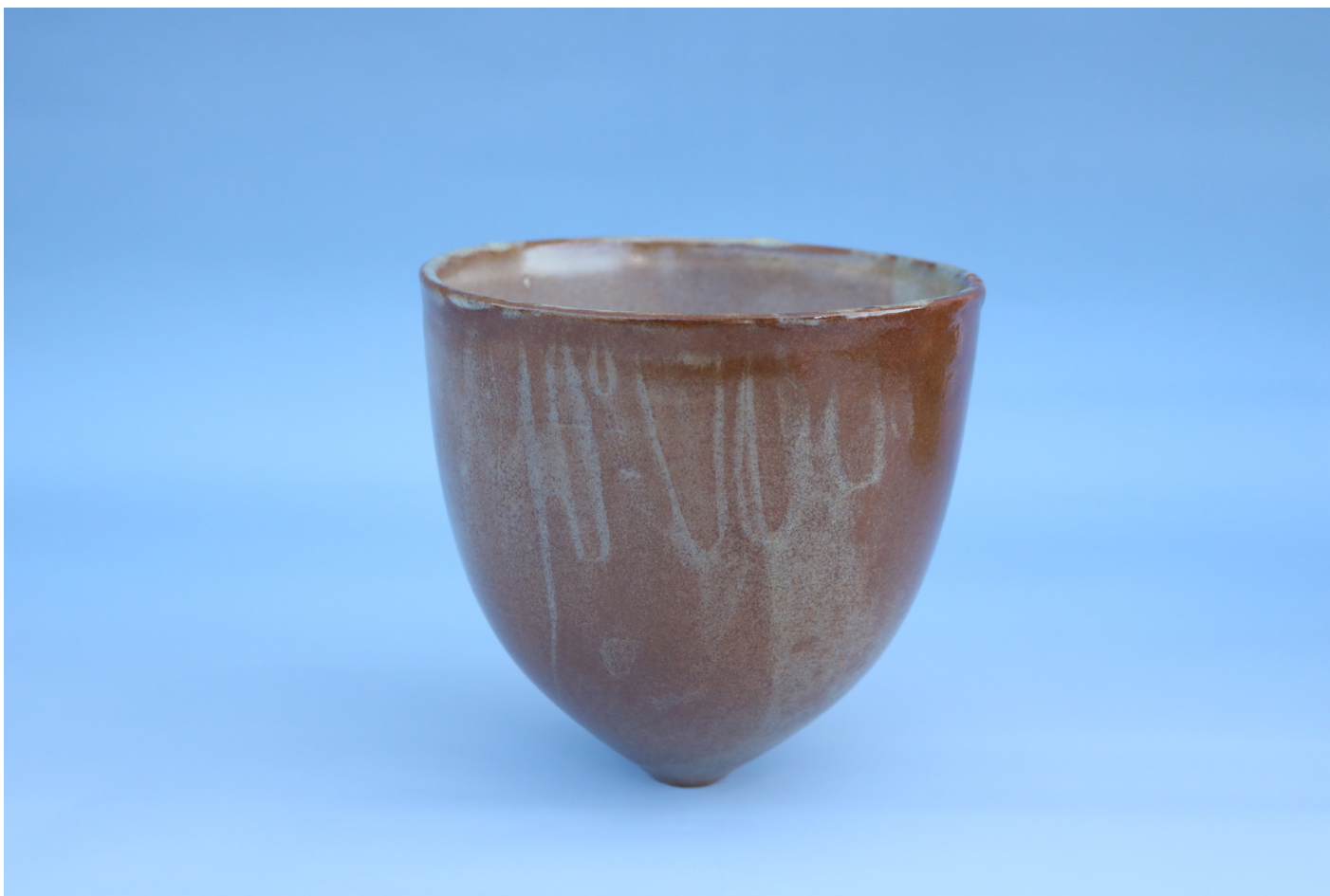
Seramik Vazo 1160 °C, 2 x 15,5 x 13 cm, 2018