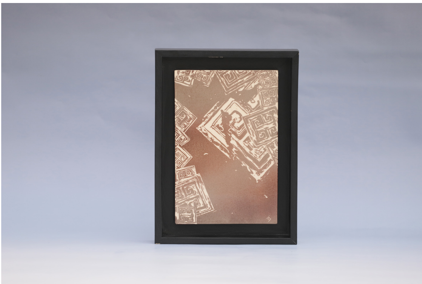
Frig 2, Seramik Pano Sigrafitto Tekniği, 1160 °C, 18 x 27 cm, 2019