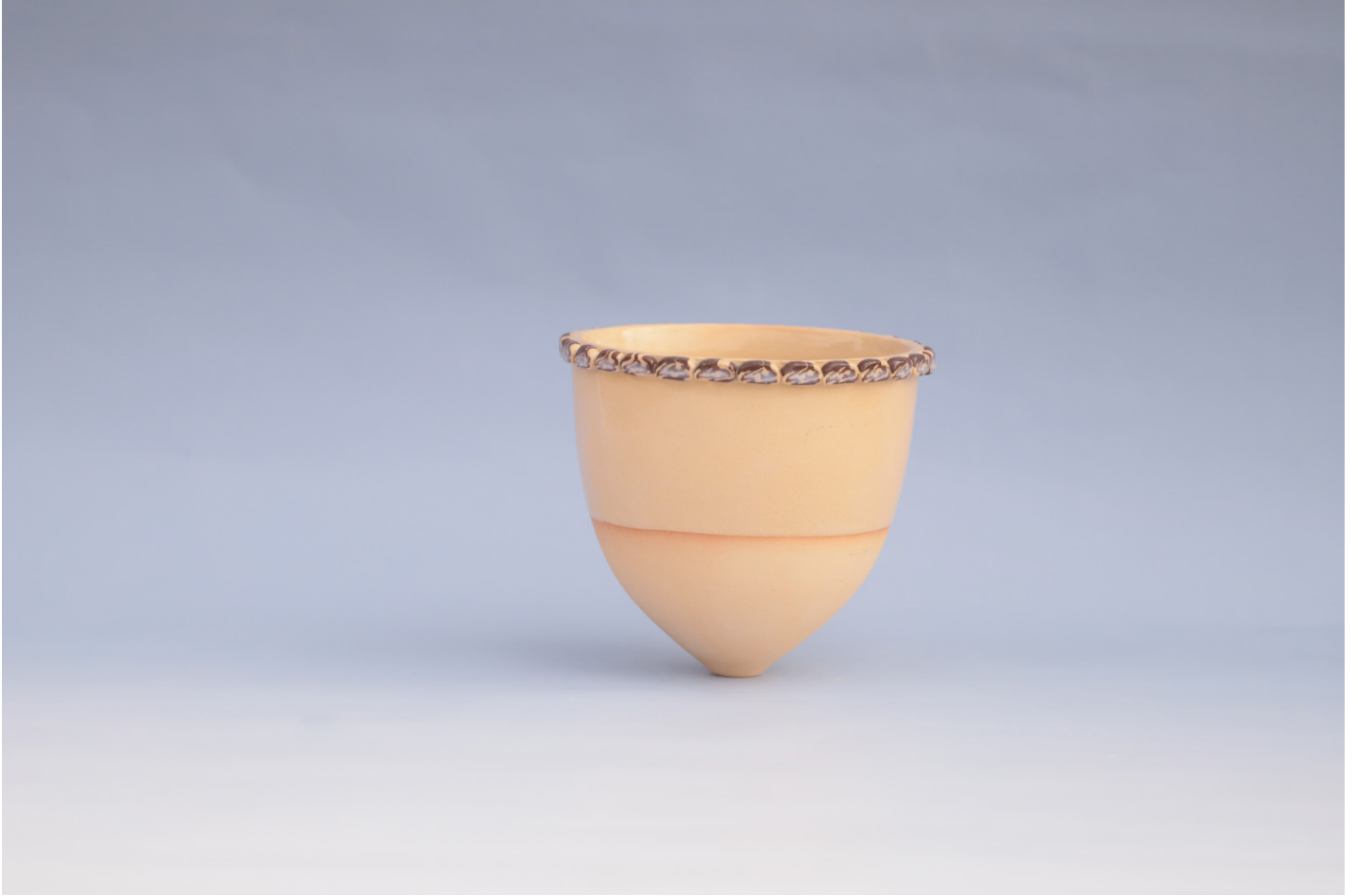
İkiz Kızlarım 2, Seramik Vazo Millefiori Tekniđi, 1160 °C, 2 x 15,5 x 13 cm, 2018