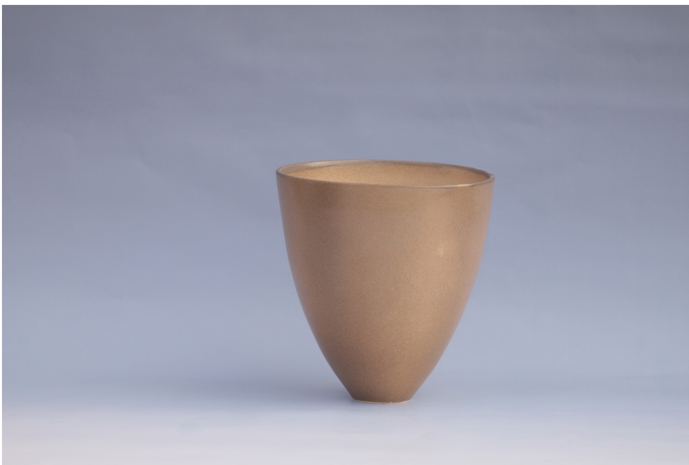
Seramik Vazo 1160 °C, 5,5 x 20,5 x 20 cm, 2018