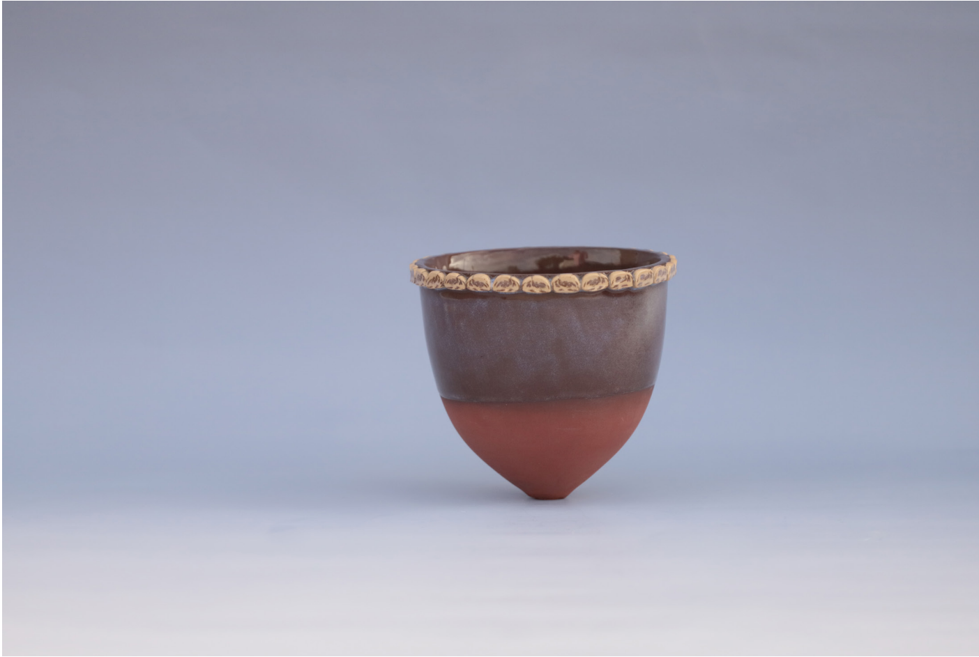
İkiz Kızlarım 1, Seramik Vazo Millefiori Tekniđi, 1160 °C, 2 x 15,5 x 13 cm, 2018