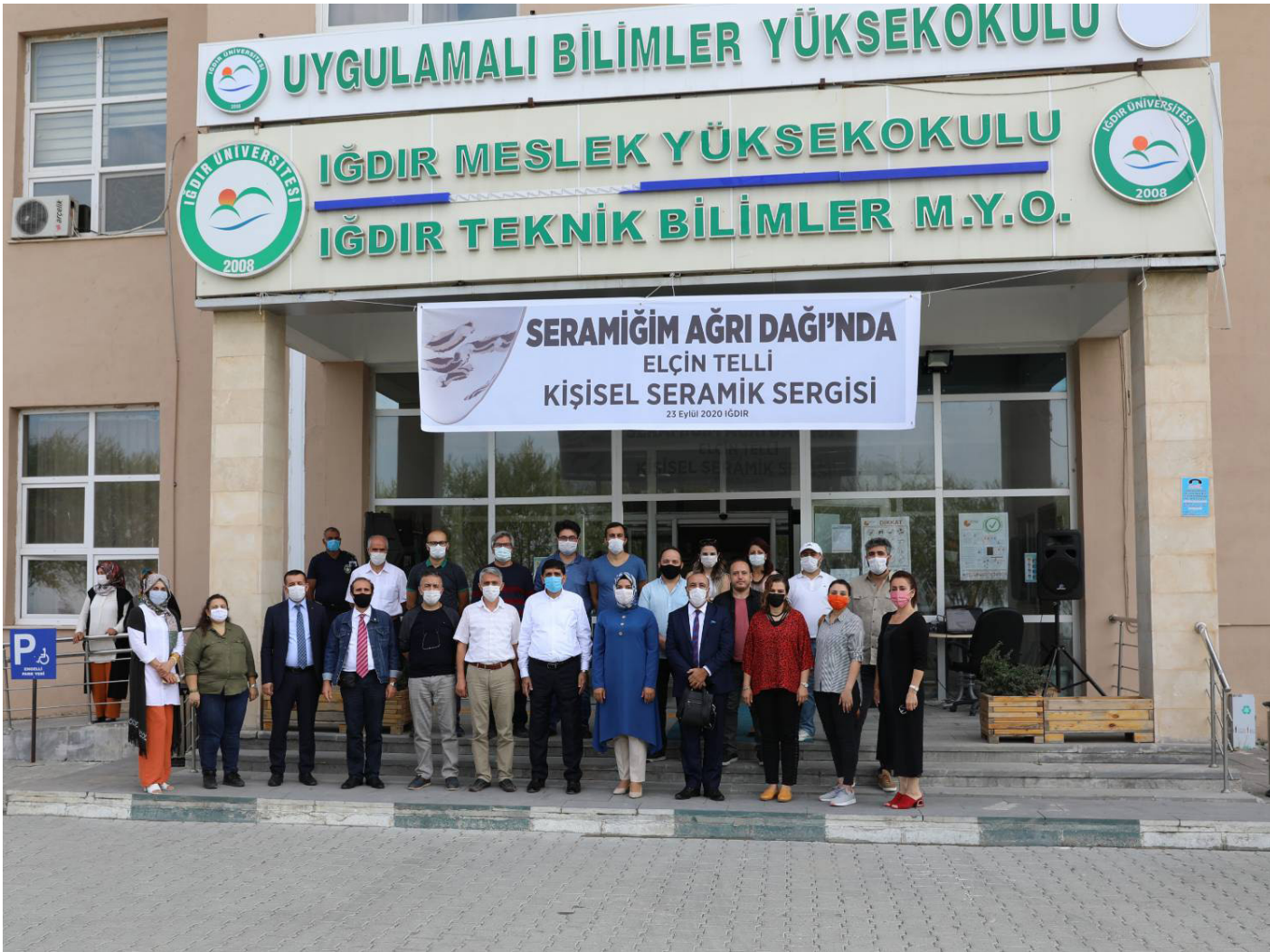
Sergi Açılış Töreni