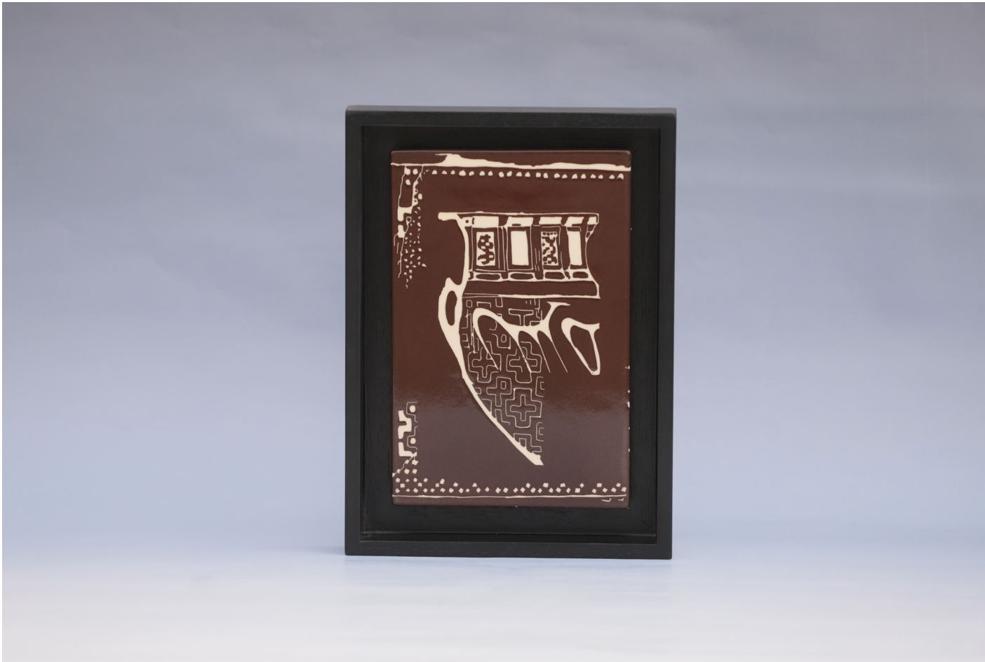
Frig 7, Seramik Pano Sigrafitto Tekniđi, 1160 °C, 18 x 27 cm, 2019