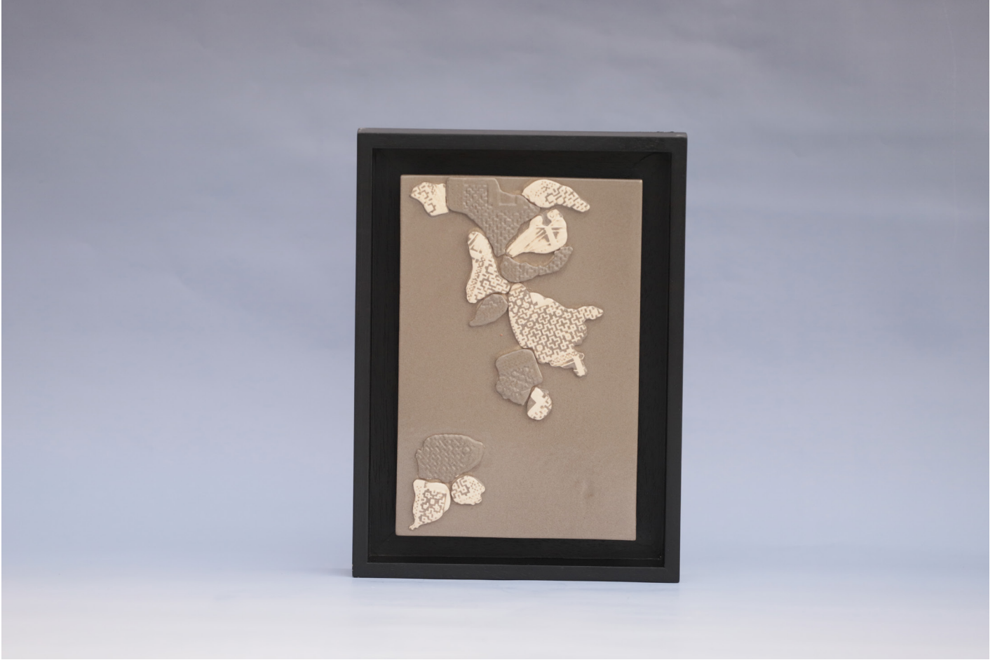
Kapı 2, Seramik Pano Rölyef Tekniđi, 1160 °C, 18 x 27 cm, 2019