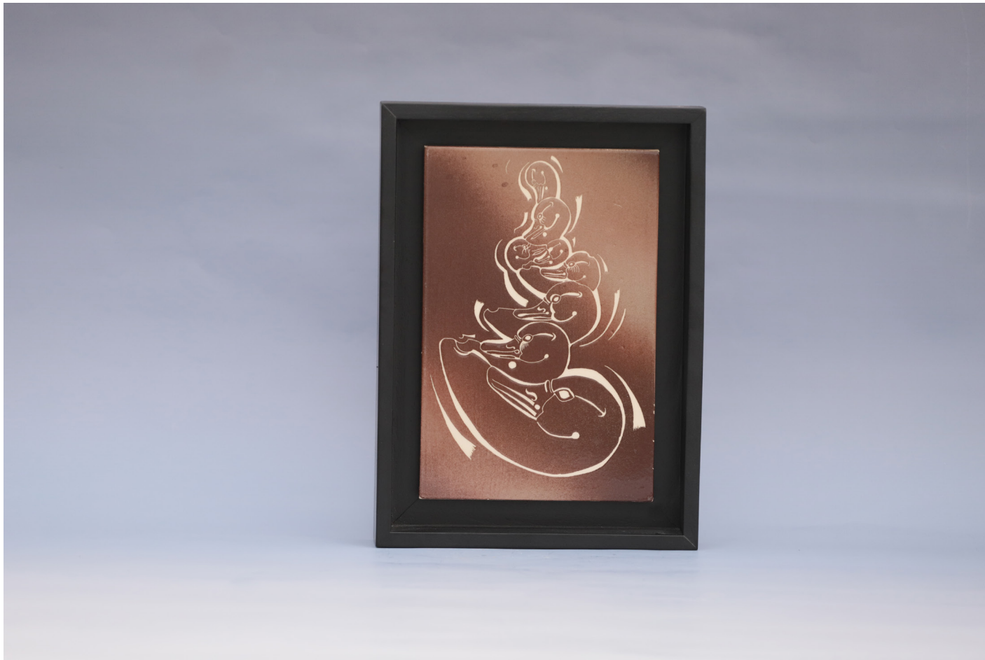
Frig 3, Seramik Pano Sgraffitto Tekniđi, 1160 °C, 18 x 27 cm, 2019