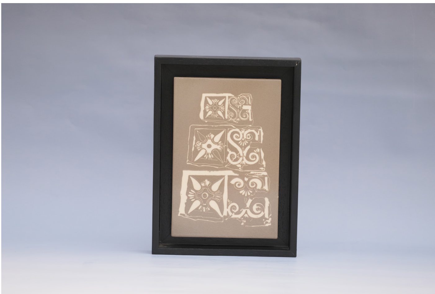
Frig 6, Seramik Pano Sgraffitto Tekniđi, 1160 °C, 18 x 27 cm, 2019