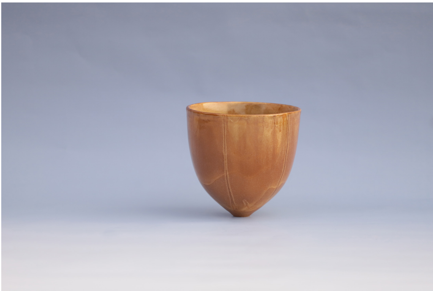
Seramik Vazo 1160 °C, 2 x 15,5 x 13 cm, 2018