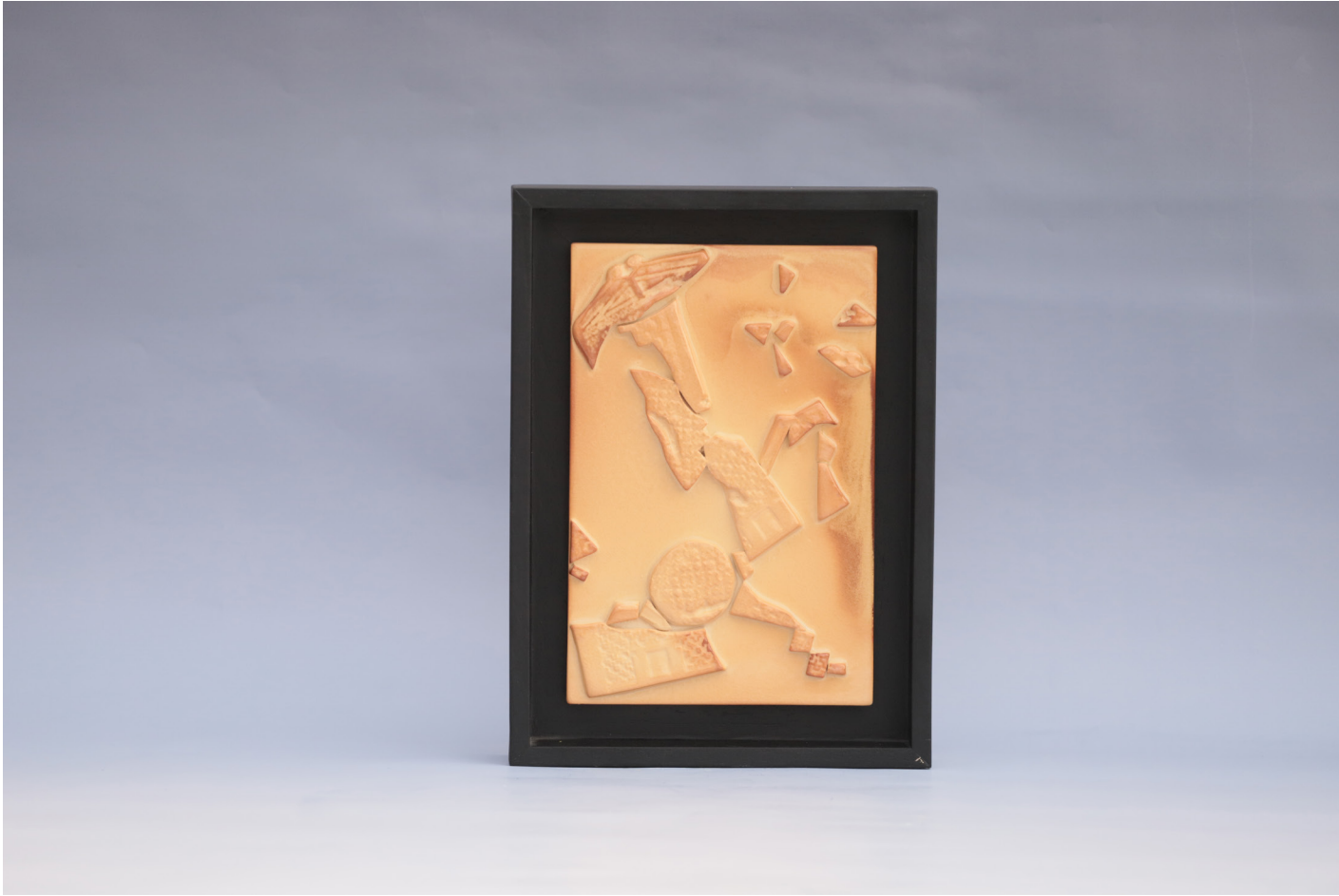
Kapı 1, Seramik Pano Rölyef Tekniđi, 1160 °C, 18 x 27 cm, 2019