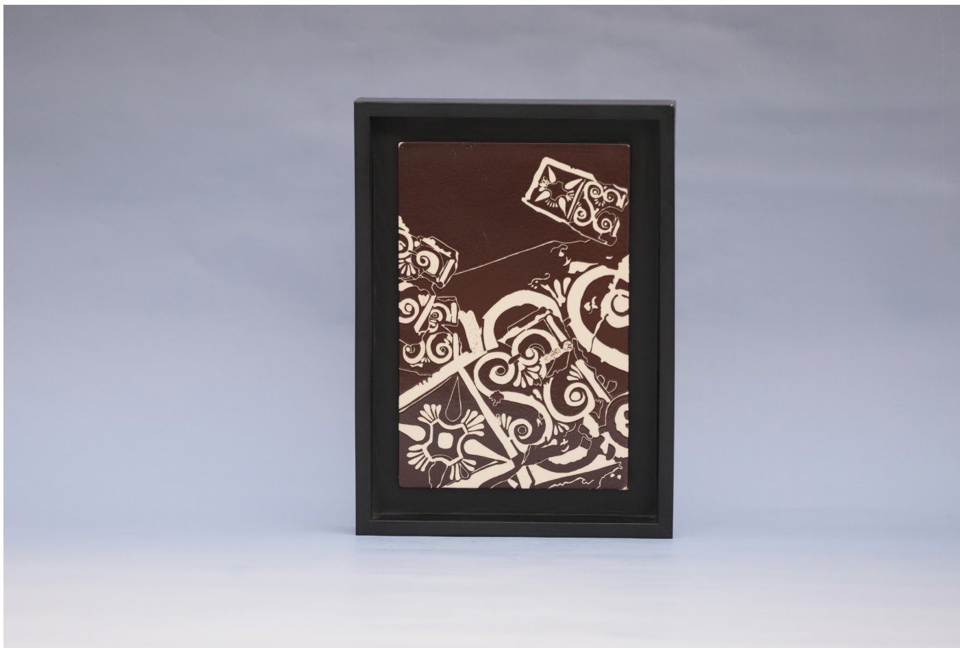
Frig 1, Seramik Pano Sigrafitto Tekniği, 1160 °C, 18 x 27 cm, 2019