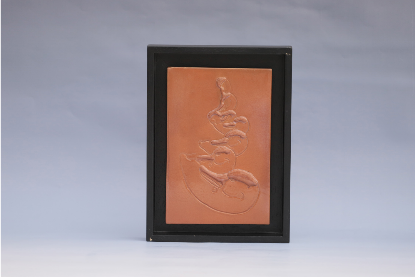
Frig 8, Seramik Pano Rölyef Tekniđi, 1160 °C, 18 x 27 cm, 2019