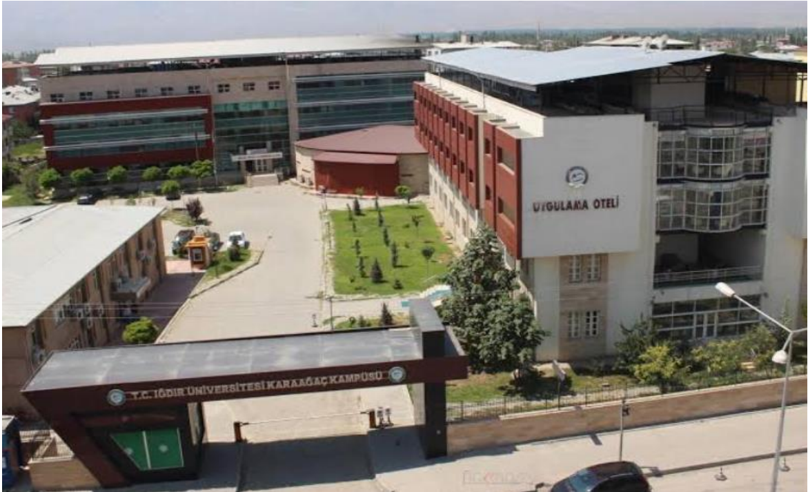
(Şekil 1): Iğdır Üniversitesi Karaağaç Kampüsü