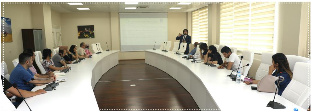
Resim-7 “YÖK Bursları” Konulu Eğitim