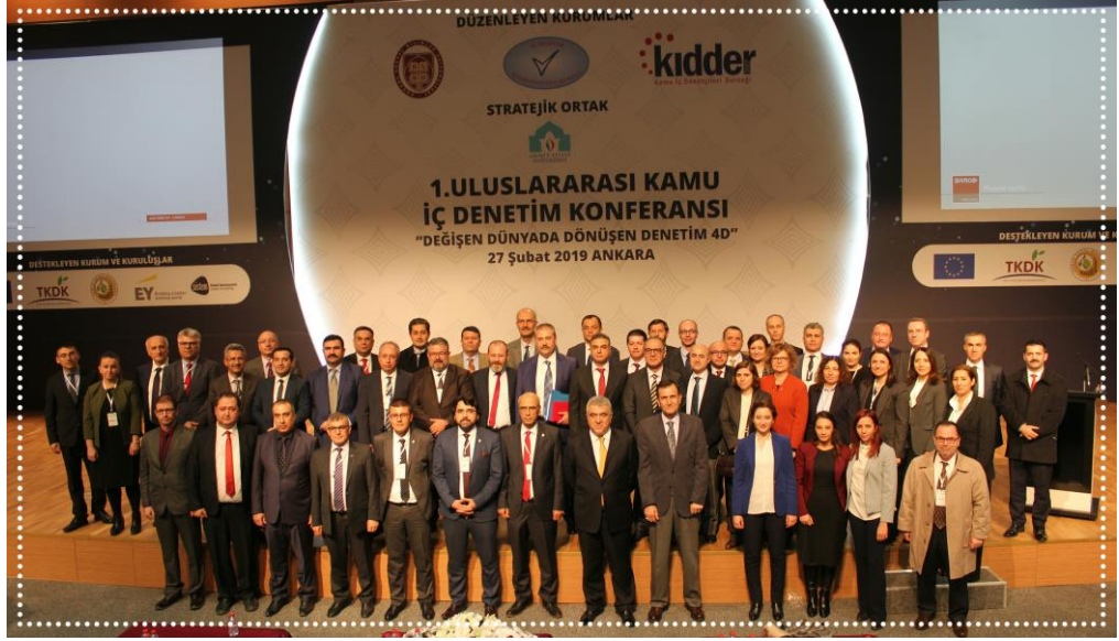
Resim-2 I. Uluslararası Kamu İç Denetim Konferansı