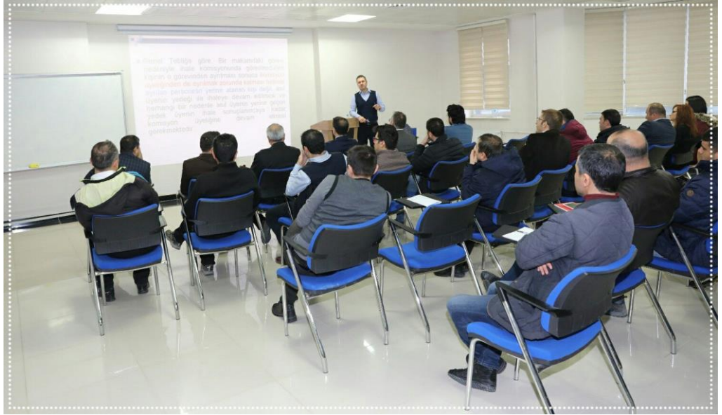
Resim-1 Beyan Usulü ve E-İhale Eğitim Semineri