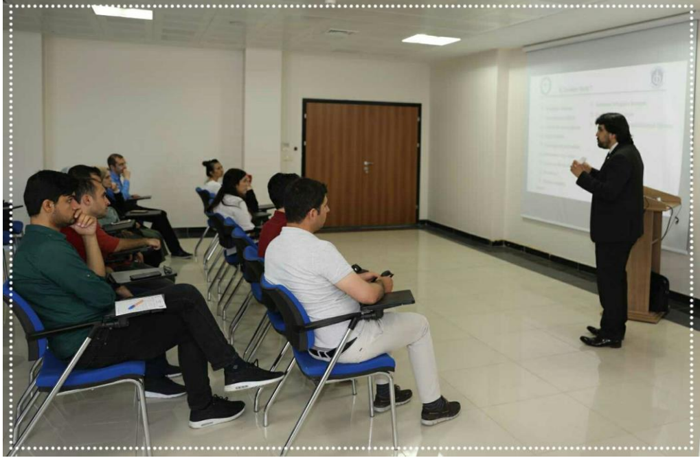
Resim-6 Aday Memurlara “Kamuda Denetim” Konulu Eğitim