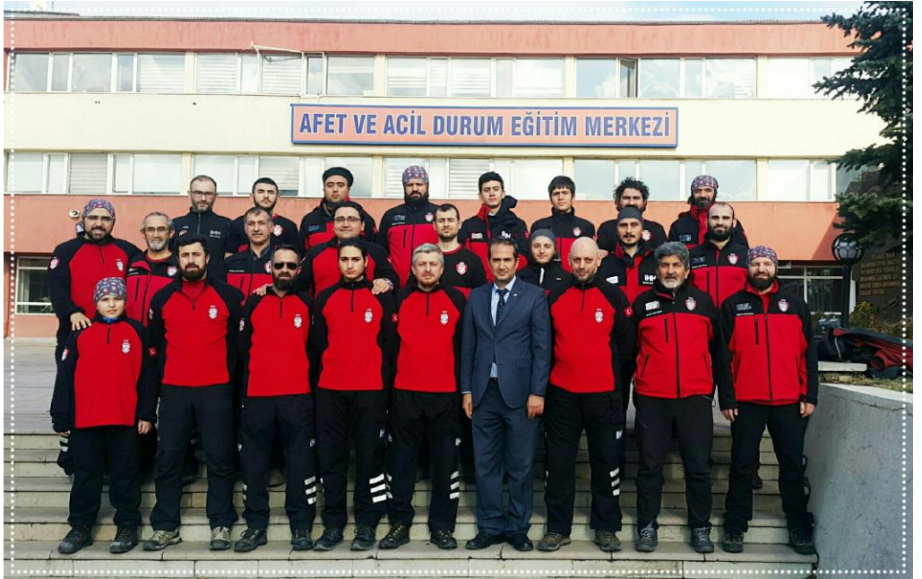
Resim-5 Temel Yangın Eğitimi