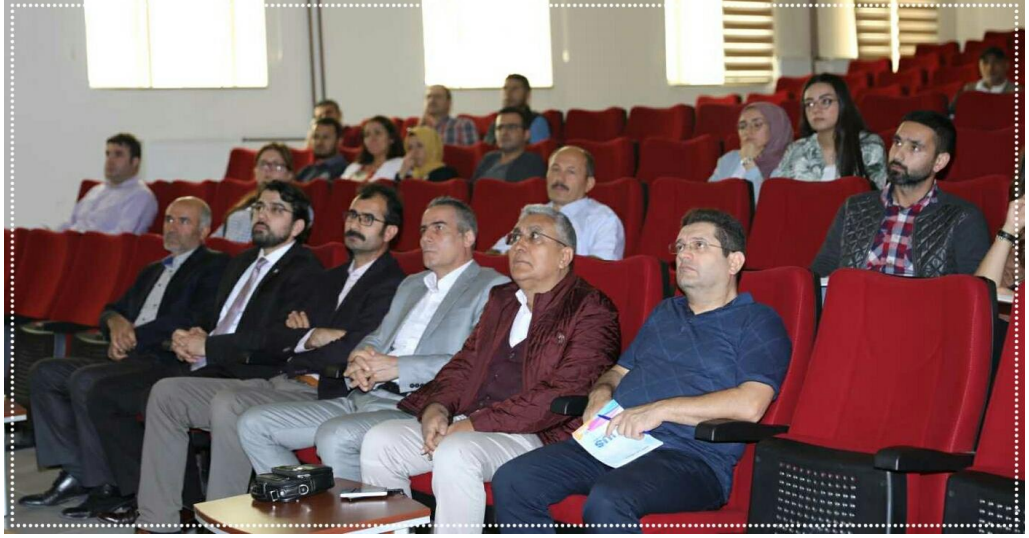
Resim-4 Springer Nature Yazar Çalıştayı