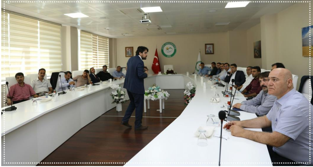
Resim-8 “Risk Yönetimi” Konulu Eğitim