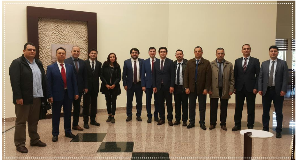
Resim-3 “YÖK Tarafından Verilen Burslar” Konulu Eğitim