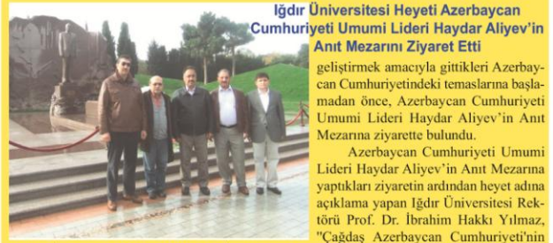
İğdir Üniversitesi Heyeti Azerbaycan Cumhuriyeti Umumi Lideri Haydar Aliyev'in Anıt Mezarını Ziyaret Etti