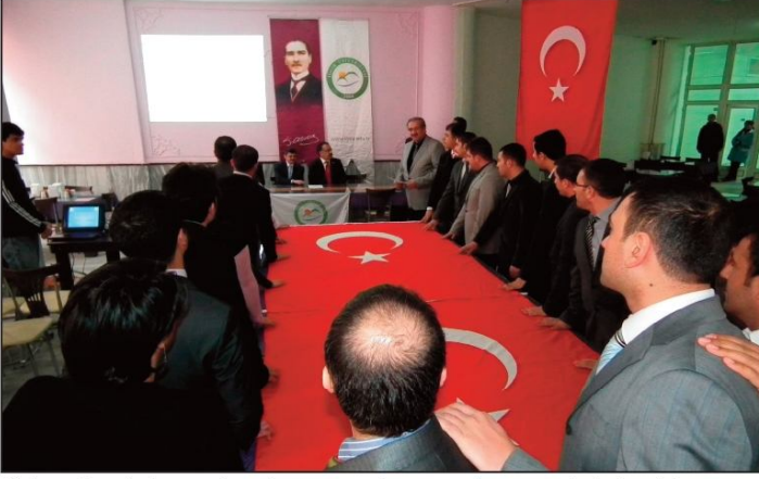
Üniversitemizde yemin eden memurların yemin merasiminden bir görüntü