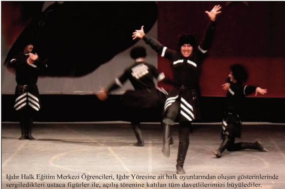
Iğdır Halk Eğitim Merkezi Öğrencileri, Iğdır Yöresine ait halk oyunlarından oluşan gösterinlerinde sergiledikleri ustaca figürler ile, açılış törenine katılan tüm davetlilerimizi büyülediler.

Bu konuşmadan hemen sonra, Kafkas Üniversitesi Devlet Konservatuvarı Öğretim Üyeleri ve öğrencilerinin oluşturduğu koro, seçme eserleri başarı ile sundu. Koronun vermiş olduğu konser sonrasında, Iğdır Halk Eğitim Merkezi öğrencileri Iğdır yöresine ait halk oyunları gösterisi yaptı.