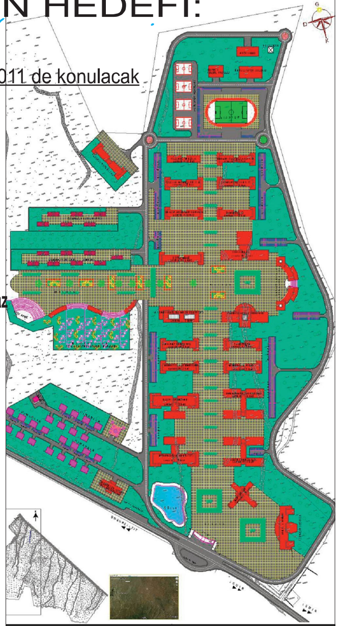
İĞDIR ÜNİVERSİTESİ KAMPÜS YERLEŞKE PLANI