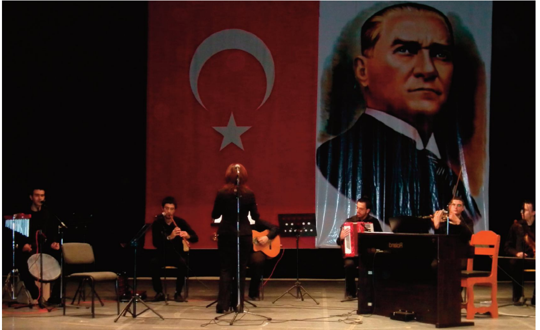
Kafkas Üniversitesi Devlet Konservatuvarı Öğretim Üyeleri ve öğrencileri konuk olarak geldikleri açılış töreninde başarılı bir konser verdiler.